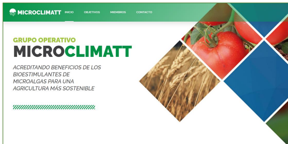
Imagen de la página de inicio de la página web de MicroClimatt.

El pasado miércoles 10 de noviembre tuvo lugar el lanzamiento de la página web del grupo operativo: https://microclimatt.es/ En la página de inicio se encuentra todo el panel de control con la información más destacada de MicroClimatt: la descripción del grupo operativo, los objetivos marcados, los miembros que lo conforman y un apartado de contacto. Se irán recopilando en la página web aquellas actuaciones desarrolladas por el grupo operativo a medida que se avance en la ejecución de las mismas.