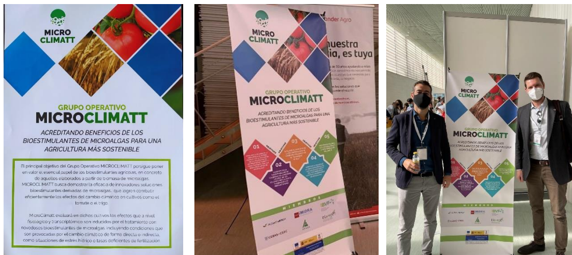
Materiales preparados para la presentación del proyecto en el congreso Microbioma2. Izda. Díptico MicroClimatt impreso; Centro y dcha. Roll-up MicroClimatt impreso y expuesto.

Se aprovechó toda la afluencia del evento para presentar el proyecto de manera oficial, además de promocionarlo con el reparto de dípticos y la exposición de rollers