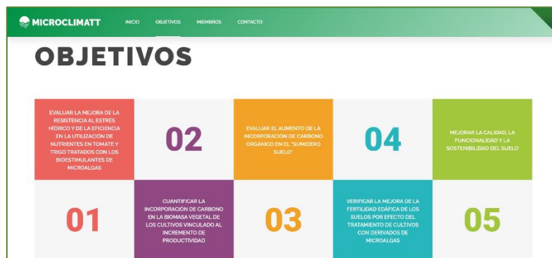
Imagen del apartado de "Objetivos" de la página web de MicroClimatt.